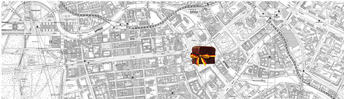
Lageplan des Berliner Stadtzentrums