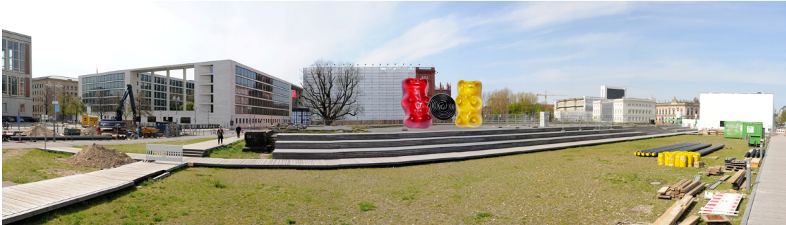
Panoramafoto vom Sockel des ehemaligen Reiterstandbildes von Kaiser Wilhelm I. Foto: Philipp Eder, 2010

Standort des Denkmals ist der Sockel des ehemaligen Nationaldenkmals für Kaiser Wilhelm I. auf der Schlossfreiheit. Bei passendem Rezept kann auch ein anderer Standort gewählt werden.