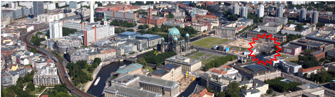
Mitten im historischen Zentrum Berlins soll das Deutsche Freiheits- und Einheitsdenkmal stehen.

competitionline lobt zum fünften Mal den Lebkuchen-Wettbewerb eat city aus. Wie in den vergangenen Jahren mit dem Berliner Stadtschloss (2004), dem Turmhaus auf dem Berliner Spredreieck (2006) und dem Aufruf zu neuen Rezepten für den Flughafen Tempelhof (2008) greift auch eat city 2010 ein viel diskutiertes Thema auf: das geplante Freiheits- und Einheitsdenkmal auf der Berliner Schlossfreiheit.